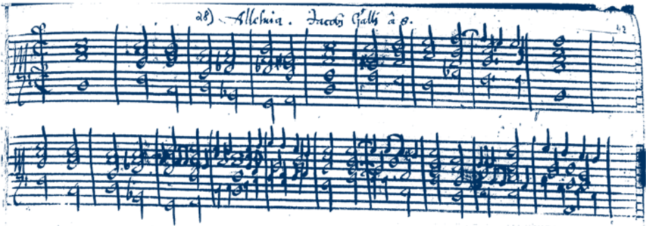
Abbildung 1: Iacobus Handl-Gallus, Alleluia. [Cantate Domino canticum novum], Bayerische Staatsbibliothek München, Musikabteilung, Signatur: Mus.ms. 4480, fol. 42r.

und bei den kleineren Notenwerten kommen Fähnchen zum Strich hinzu. In manchen Tabulaturbüchern wurde ein Rastersystem erstellt, bei dem in ein Kästchen Notenwerte im Gesamtumfang einer Brevis, also zwei Semibrevis des geraden Takts ( integer valor ) eingetragen werden. Hier lässt sich vom Tempus -Abstand beziehungsweise von den Tempora sprechen, wie beispielsweise vom deutschen Musiktheoretiker Nikolaus Gengenbach im Traktat Musica nova von 1626 erläutert wurde: TEMPUS, bedeutet in der Musica zweene Tactus, als wenn ein Organist seine Tabulatur/ oder ein Componist seine Partitur in Tempora eintheilet/ so machet er allezeit nach zween Schlägen einen Strich durch die Linien: Inmassen auch heutiges Tages der Bassus continuus in Tempora eingetheilet wird. 29 Die Verwendung der Tempus -Striche ist nicht bindend. Sie fehlen meistens in den Gebrauchshandschriften, die ohne repräsentativen Anspruch erstellt wurden. Regelmäßig sind in den Quellen nach der Dauer einer Semibrevis jedoch mehr oder weniger deutliche Leerräume vorhanden, die den Tactus -Abstand anzeigen. Nicht uninteressant ist, dass in den Handschriften mit Liniensystemen aus dem deutschsprachigen Raum bei den Intavolierungen von Vokalmusik keine Tempora sondern Tactus -Striche verwendet werden (Abbildung 1).