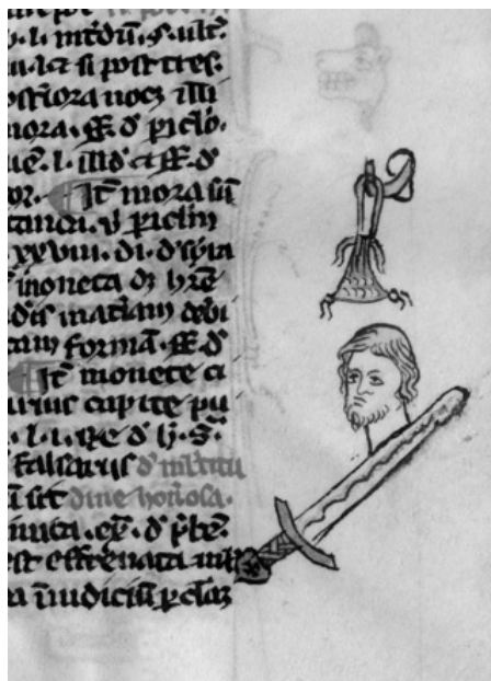
Slika 2: Kaznovanje prevaranta zaradi pohlepa ali ponarejenega denarja, Monaldus de Iustinopolis: Summa de iure canonico , ok. 1300, pariško delo (fol. 177r), Ljubljana, Narodna in univerzitetna knjižnica, Ms 33.

Pisanje o nesmiselnosti upodobitev (Kos-Stelè, 1931, 68) nas ne sme čuditi, ker je 20. stoletje pozabilo, da so pojmovni svet in čustveno zaznavanje v srednjem veku določali drugačni dispozitivi kot mnogo stoletij pozneje. Nekoliko je k napačnemu ocenjevanju pripomoglo tudi epohalno delo Émila Mâla o nabožni umetnosti 13. stoletja v Franciji, v katerem je avtor velikemu delu upodobitev pripisal vlogo dekoracije, posebej tistim, ki niso že na prvi pogled izkazovale nabožne ikonografije: takrat se je zdelo, da ni logike v neposrednem stiku med resnimi nabožnimi vsebinami in detajli, ki so v velike programe priromali iz na videz na glavo postavljenega sveta. Poznejši spisi o antropologiji in psihologiji srednjega veka so pokazali, da ima neposredni pogled prav tako svojo zrcalno podobo, da resničnost vsakdanjika razbremenjujejo humorni akcenti, da so številni zmaji pravzaprav povečani martinčki, da je v vsem veliko šaljivosti, pripovedk, basni, satiričnega in anekdotičnega itd. To je spomin, ki je imel (predvsem) govorno podobo in smo ga pozabili. Vendar je Mâlova knjiga vplivala na velik del umetnostne zgodovine 20. stoletja: zato so nekatere risbe na marginah Monaldove pravne enciklopedije pri bralcih rokopisov v 19. in 20. stoletju sprožile nasmeh, posmeh, nejevero in nerazumevanje. 25