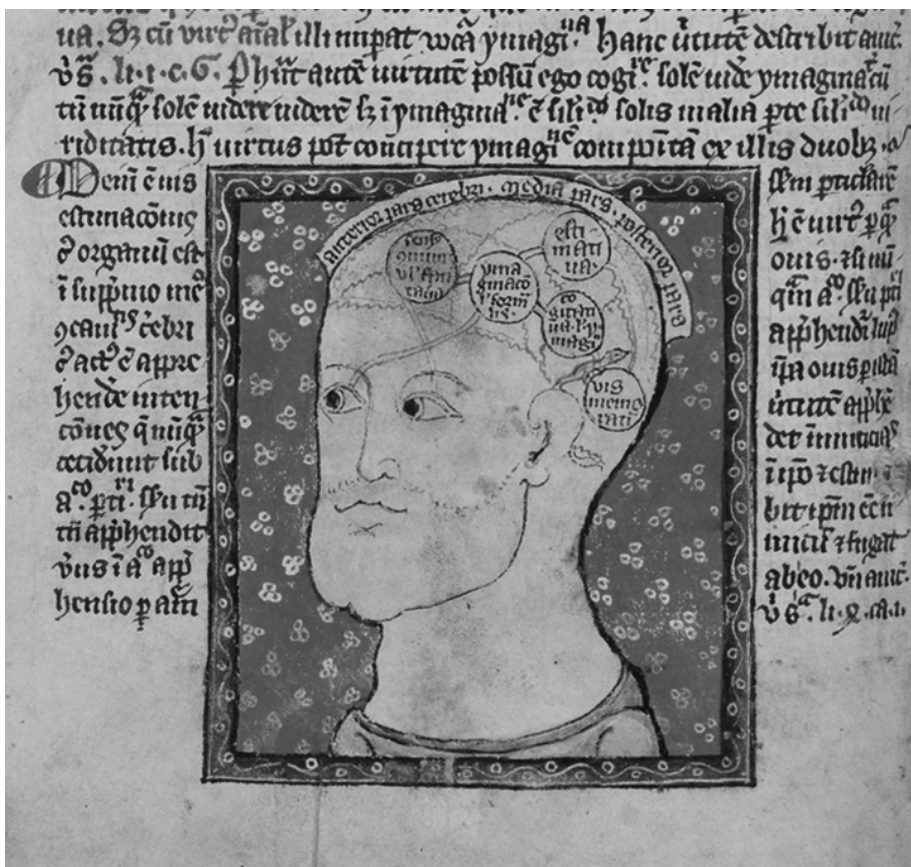
Slika 1: Qualiter caput hominis situatur (fol. 491v), Trilingual compendium of texts, po 1307, angleško delo. Cambridge, University Library, Ms Gg 1.1, https://cudl.lib.cam.ac.uk/view/MS-GG-00001-00001/988 .

medicine, 5 ki je z izkušnjami arabske medicine nadomestil starejše medle in široke opise zaznavanja (Slika 1). 6