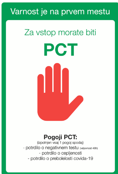
Slika 1: Znak za pogoj PCT za vstop/storitev, vir: https://www.nalepke.net (dostop 31. 7. 2024)

Primer poleg ponazoritve možne obravnave sporazumevalnih načel in strategij ter povezovanja pouka jezika in književnosti (v tem primeru popularne literature) predstavlja priložnost za razpravo o nasilju v komunikaciji (skupni cilj), 5 odnosih nasploh idr.