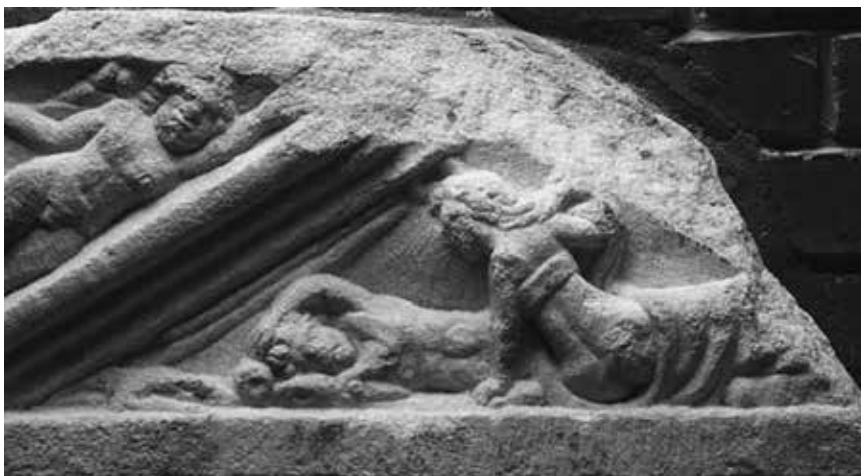
Slika 7: Endimion in Seleno v zatrepu stele, Kiskajd, Madžarska, UEL 3330.

zeja in Minotavra, 33 Ahila in Hektorja, 34 Odiseja in Polifema, 35 Ojdipa in Sfingo, 36 Belerofonta in Himero, 37 vsi razen Ahila in Hektorja pa se na sarkofagih upodablajo zelo redko. Med motivi ugrabitve najdemo Evropo, 38 ki je na sarkofagih sploh ni, in Ganimeda, 39 ki je le redki motiv sarkofagov, medtem ko je z edikul v celoti odsoten na sarkofagih zelo pogosti motiv ugrabitve Perzefone. Med motivi slovesa najdemo slavne pare: Hipolita in Fajdro, 40 Adonisa in Afrodito, 41 Alkestido in Admeta, 42 Ahila in Deidamejo (Ahil na Skirosu), 43 Tezeja in Ariadno, 44 ki so na sarkofagih sicer bolj ali manj pogosti, a tudi Eneja in Kreuzo, 45 ki ju na sarkofagih ni. Med slavne pare, ki tematizirajo rešitev pred smrtjo in ponovno srečanje, sodijo Herakles in Heziona, 46 Perzej in Andromeda, 47 Herakles in Alkestida, 48