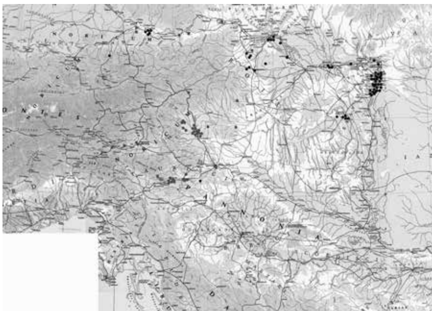
Slika 2: Karta razprostranjenosti mitoloških reliefov v Noriku in obeh Panonijah. Z rdečo barvo so označeni marmorni reliefi, z modro barvo pa tisti iz apnenca.

Če vse razgrajene ostanke nagrobnih edikul kartiramo tudi glede na vrsto kamnine, iz katere so izdelane (slika 2), ugotovimo, da se pomembno koncentrirajo v bližini večjih kamnolomov: marmorne predvsem na prostoru med Virunom, Celeio, Petoviono, Solvo in na območju severno od teh mest, tiste iz apnenca pa na dveh območjih, t.j. predvsem na prostoru od Aquinca do Brigetija na severu in Gorsija ter Intercise na jugu ter med Skarbantijo, Vindobono in Carnuntom. Vmesna območja zapolnjujejo predvsem stele.