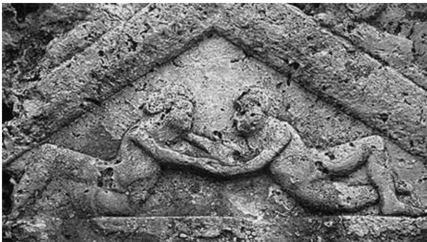
Slika 6: Adonis in Afrodita v zatrepu stele, Tata, Madžarska, UEL 694.

Če primerjamo motive noriško-panonskih mitoloških prizorov ter njihovo priljubljenost s tistimi, ki se pojavljajo na sarkofagih, pridemo do podobnih ugotovitev. Med motivi nenadne, usojene smrti najdemo Aktajona, 28 Ikarja, 29 Hipolita 30 in Medejo, 31 nikakor pa ne glavnih tovrstnih motivov, ki so upodabljeni na sarkofagih – Meleagra in Ahila. Med motivi smrti izpod rok herojev najdemo na edikulah motiv Perzeja in Meduze, 32 Te-