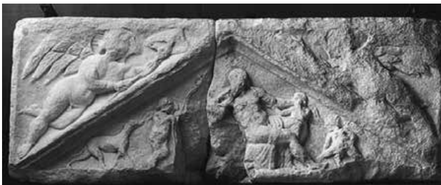
Slika 5: Adonis in Afrodita v zatrepu stele, Starše, Slovenija, UEL 1731.