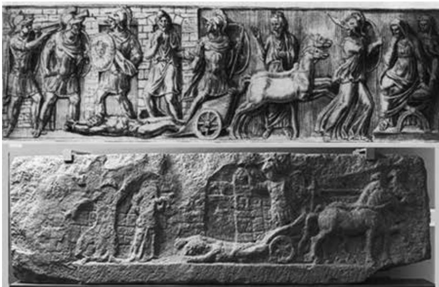
Slika 4: Zgoraj: risba (Codex Coburgensis) sprednje stranice izgubljenega sarkofaga iz Firenc s prizorom Ahila, ki vleče Hektorjevo truplo okoli Troje (ASR XII, Textabb. 4). Spodaj: del edikule iz Budimpešte s prizorom Ahila, ki vleče Hektorjevo truplo okoli Troje, UEL 2703.

O pomembnem vplivu umetnosti sarkofagov na figuralno kulturo noriških in panonskih nagrobnih spomenikov ni dvomiti. O tem nas hitro prepričajo primerjave posameznih figur 27 ali kompozicij (Ikar, Ahil-Hektor-Priam, Mars in Rea Silvia, Endimion in Selena, Orest-Pilad-Ifigenija, Medeja), ki dokazujejo obstoj delavniških sredstev za prenos modelov (slika 4). A vzporedno z njimi obstaja vrsta zelo priljubljenih motivov in kompozicij, ki jih z rimskih sarkofagov ne poznamo (Skila in Minos, Perzej in Andromeda, Herakles in Heziona, Enej in Kreuzu). Ti motivi pričajo o zelo bogatem mitološkem repertoriju glavnih kiparskih delavnic Norika in Panonije in o njihovi sposobnosti sestavljanja kompozicij in prilagajanja kompozicij oblikam figuralnih polj (Adonis in Afrodita, Endimion in Selena; slike 5, 6 in 7).