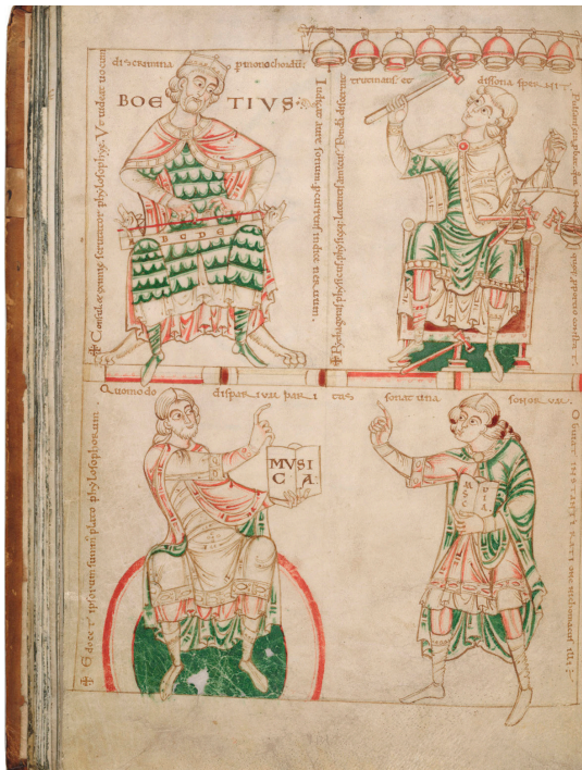
Ilustracija iz rokopisa Boetijeve De institutione musica , 12. stoletje, Cambridge University Library